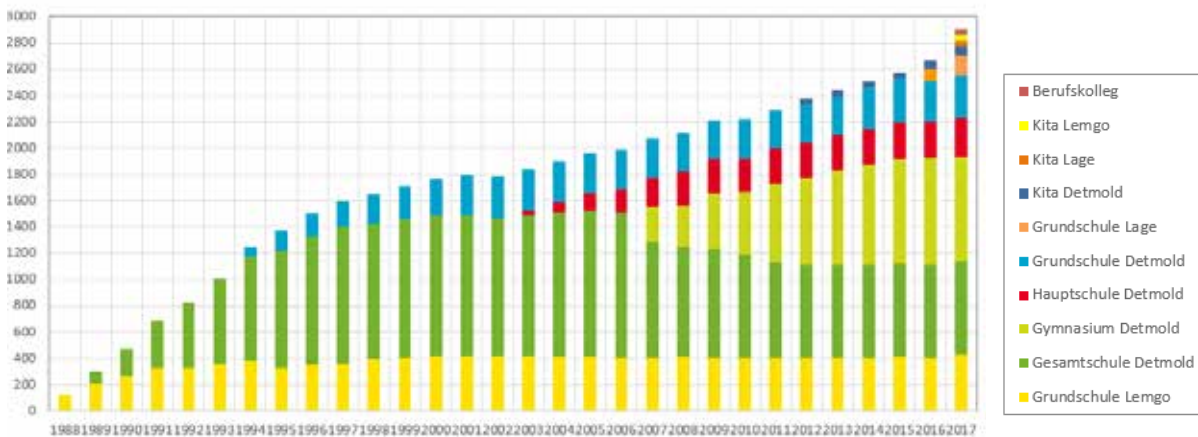
Die Grafik zeigt die Entwicklung der Schülerzahlen und Bildungseinrichtungen von 1988 bis 2018.