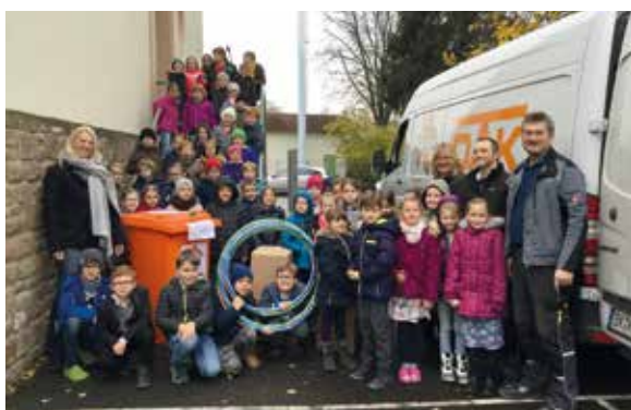
Voller Vorfreude nehmen die Kinder und Mitarbeiter die Spieltonne entgegen.

Sportunterricht integriert werden. Seit Januar werden die Geräte über die Spielzeugausleihe auch in den Pausen auf dem Schulhof zur Verfügung gestellt.