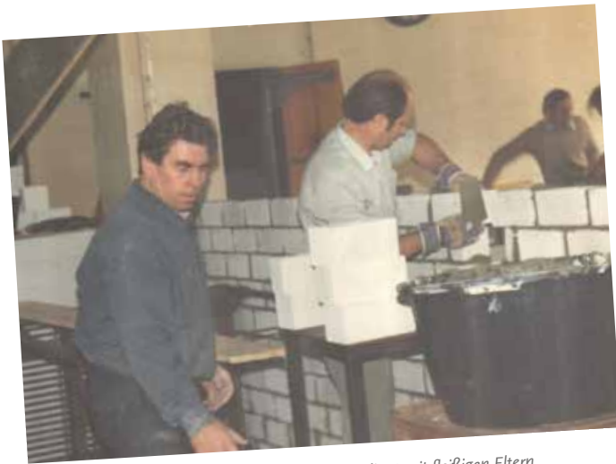
Der Umbau von einer Zigarrenfabrik zur Schule gelingt mit fleißigen Eltern.