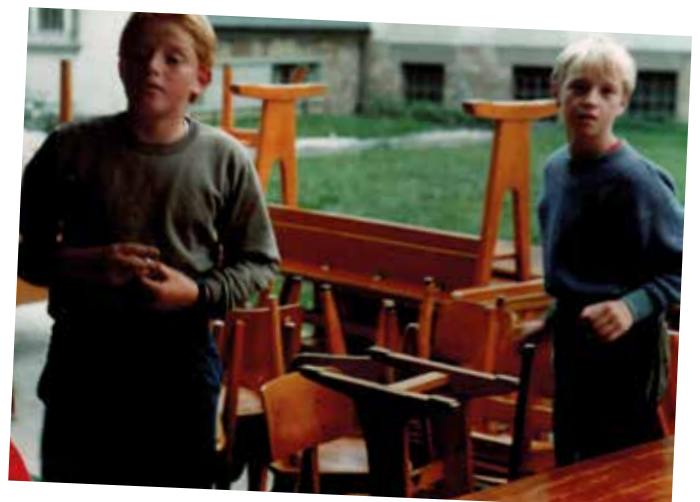
Die ersten Schulmöbel werden angeliefert.