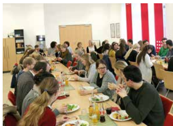
Gute Gemeinschaft bei gutem Essen ist ein wichtiger Teil der Veranstaltung.