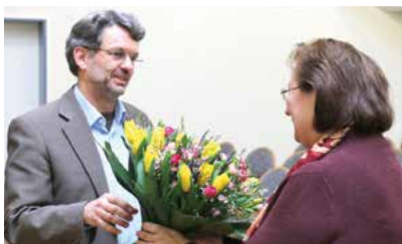
Blumen zum Abschied von Herrn Herm.