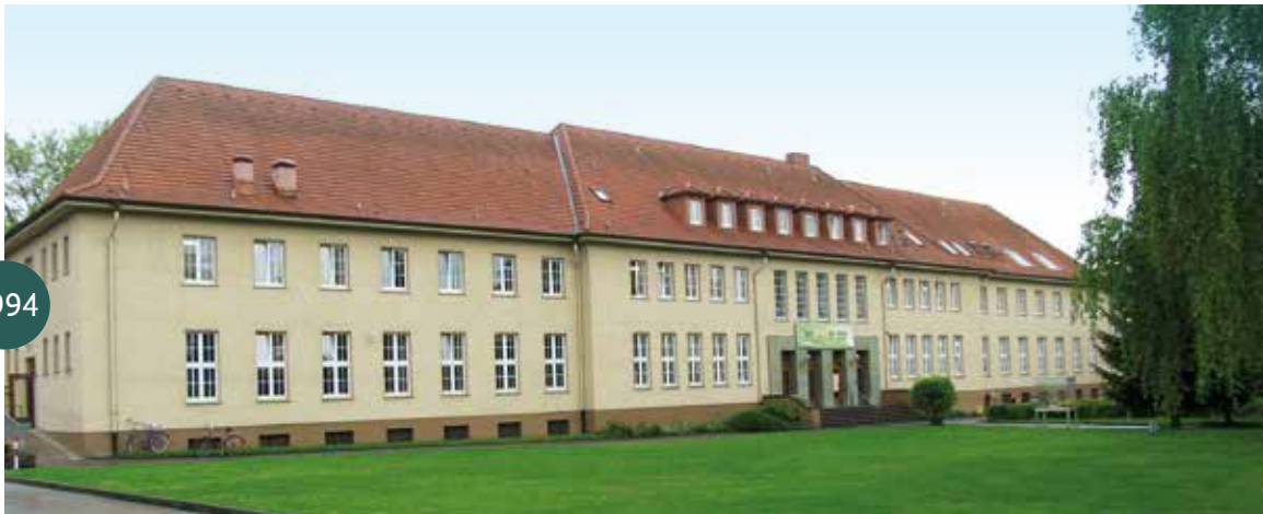
Die Gesamtschule bezieht die ehemaligen Kasernen in der Georgstraße.