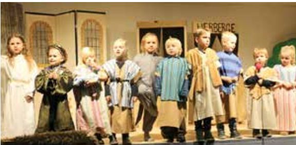
In tollen Verkleidungen spielen die Kinder die Weihnachtsgeschichte nach.

Anfang Dezember herrschte bei uns in der Kita Weihnachtsstimmung. Die Gruppen wurden schön dekoriert, Weihnachtslieder wurden gesungen und Plätzchen gebacken. Aber vor allem waren die Erzieher und auch die Kinder sehr damit beschäftigt unsere erste Weihnachtsfeier vorzubereiten.