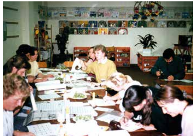
Auch bei der Erstellung der ersten Unterrichtsmaterialien helfen die Eltern fleißig mit.