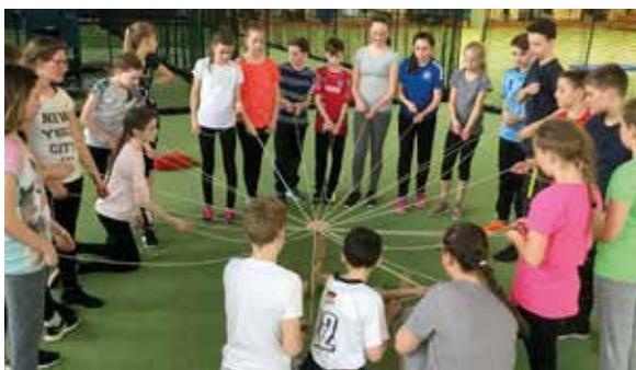
Konzentration und Geschicklichkeit sind im Ahorn-Sportpark gefragt.

Ganz nach der Lebenseinstellung von Heinz Nixdorf aus Paderborn gestalteten wir unseren Ausflugstag. Zunächst absolvierten wir ein Sportprogramm im Ahorn-Sportpark mit interessanten Spielen, um die Klassen-