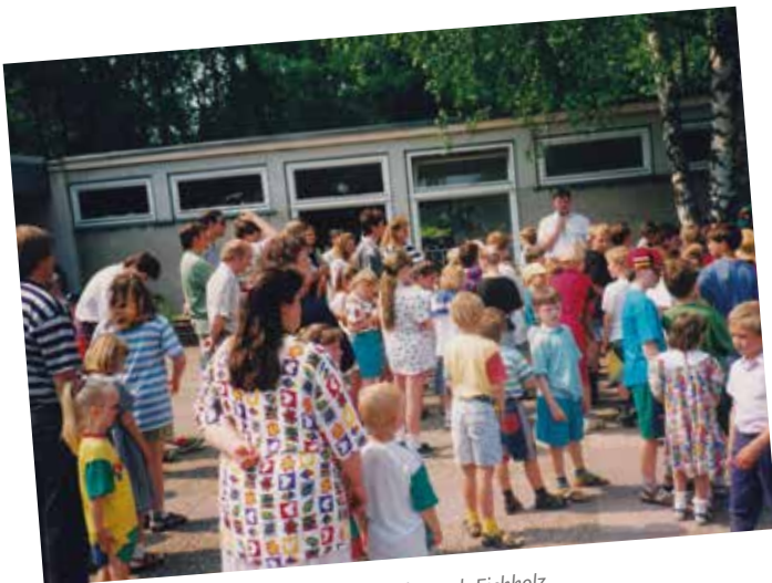
Die zweite Grundschule startet in Detmold, Sport-Eichholz.