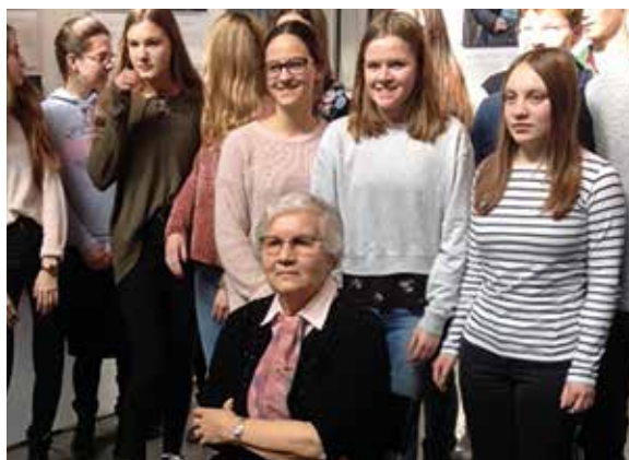
Schüler der 10. Klasse mit einer Überlebenden von Auschwitz.