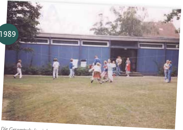
Die Gesamtschule wird gegründet und bezieht Räume in Detmold, Sport-Eichholz.