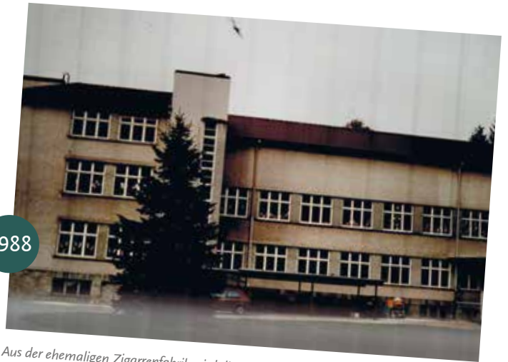
Aus der ehemaligen Zigarrenfabrik wird die erste AHF-Grundschule in Lemgo.