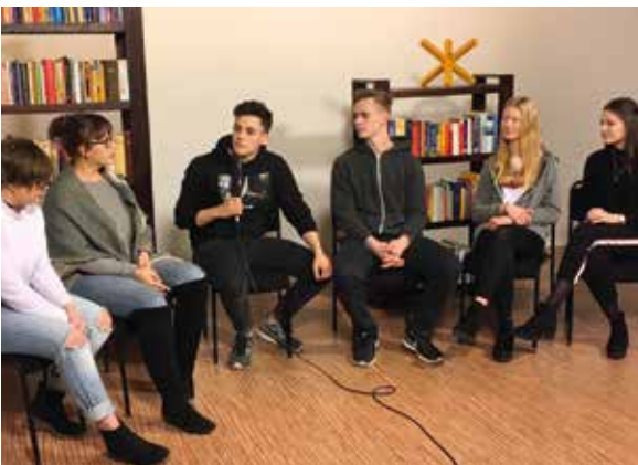
Schüler in einer Diskussionsrunde beim Fernsehsender BibelTV.

Wir, die beiden Reli-Leistungskurse der Q1, sind Mitte Februar auf eine dreitägige Exkursion nach Hamburg aufgebrochen. Nach unserer Ankunft am Abend haben wir eine Hafensrundfahrt auf der schön beleuchteten Elbe gemacht und die Elbphilharmonie besichtigt. Am nächsten Morgen sind wir mit der Fähre zur Seemannsmission gefahren, die auf Johann Hinrich Wichern zurückgeht. Dort bekamen wir einen Einblick in die Arbeit und die Mission unter den Seemännern. Die Seemannsmission ist eine christliche Herberge, welche speziell für Seemänner eingerichtet ist, die nur für kurze Zeit auf dem Festland sind, während ihre Schiffe entla-