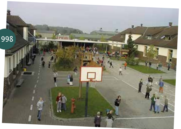
Auch die Grundschule zieht in die Georgstraße um.